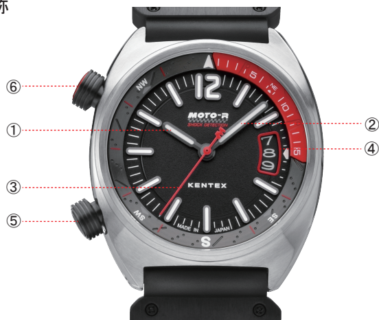
①時針 ②分針 ③秒針 ④カレンダー ⑤リユーズ ⑥インナーリング操作リユーズ